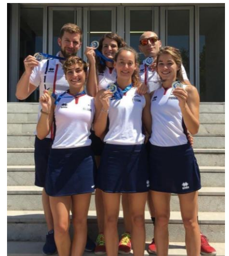
L'équipe de France Elite, championne d'Europe en 2017